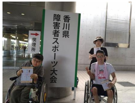
先月紹介したスポーツ大会の様子です。