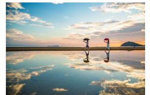
インスタ映えスポットです！

太陽の光を浴びながら、海辺を歩いてみてください。深呼吸したり、体を 大の字に伸ばしてみてください。気持ち良いですよ(#^#)