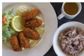
カキフライランチ