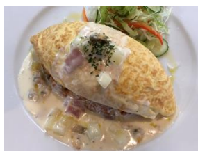
クラムチャウダーソースのオムライス