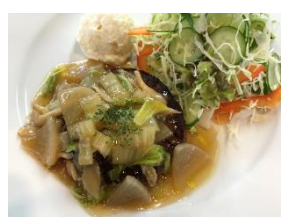
冬野菜の和風あんかけハンバーグ