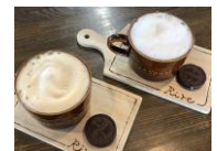
小豆とミルクとホットミルク

〒768-0072 観音寺市栄町3丁目5-3-2 TEL : 0875-24-8111 FAX : 0875-24-8141