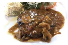
シャスールソースのハンバーグ

連日暑い日が続く、利用者様もしっかりと塩分摂取、水分補給を行いながら、施設外就労やリール内の作業にと頑張っています。また、新型コロナウイルス感染症の感染状況も終息する気配が見えず、リールでも感染拡大を防ぐ為に入店の際は、すべてのお客様に検温を実施させて頂いています。中々明るい話題が見えづらい中、利用者様をはじめ我々、職員も日々奮闘しております。また、レストランではお客様に喜んで頂くため、9月より秋メニューの販売を開始しました。感染防止対策をしっかり行い、リールは安心してご利用頂けますので、皆様ぜひとも足をお運び頂けるよう、よろしくお願い申し上げます。