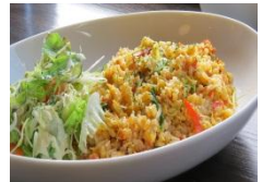
アサリとサクラエビの アメリカヌオムライス