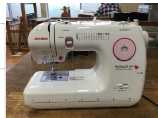
↑霊友会さんから頂いた寄付で、今までよりパワーの強いミシンを購入しました。