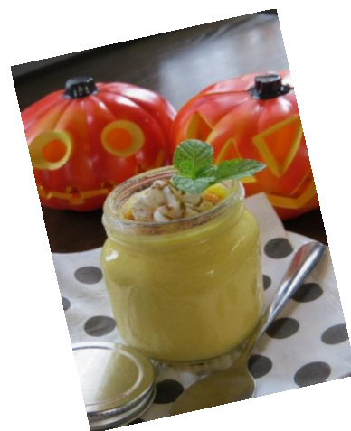
好評！ パンプキンのセミフレッド 定価300円