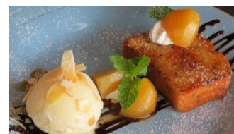
新作スイーツ!! お羊のパウンドのキャラメリゼ マロンアイス添え♡

4月からリールで勤務させて頂いている大西と申します。主に美容部門を担当しておりますが、レストランの厨房でもお仕事をさせて頂いています。